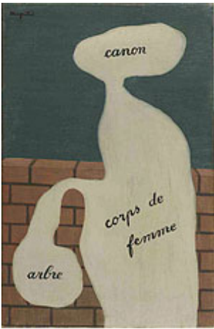
René Magritte, De boom van de kennis , 1929