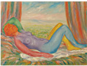
René Magritte, De oogst , 1943