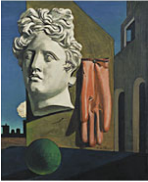
Giorgio de Chirico, Liefdeslied , 1914, New York, Moma