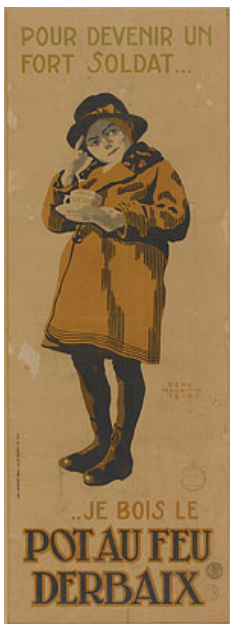
René Magritte, Pour devenir un fort soldat... (Om een sterke soldaat te worden), 1918, KMSKB