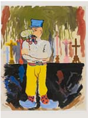
René Magritte, De misdaad van de paus , 1948