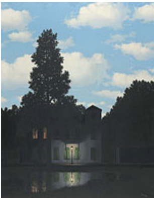
René Magritte, Het rijk der lichten , 1954