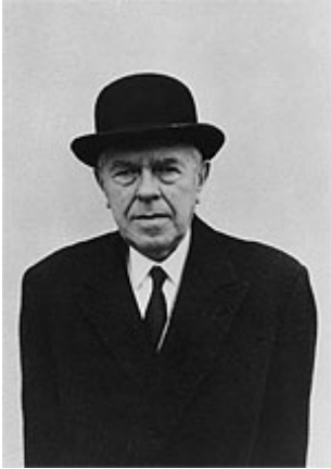
Duane Michals, René Magritte , 1967